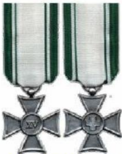
15 anni di anzianità (coniata in argento)