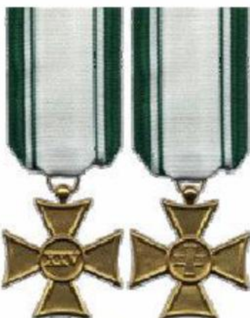
25 anni di anzianità (placcata in oro)