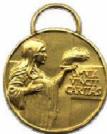
Medaglia di benemerenzza di 1° classe