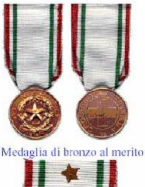
Medaglia di bronzo al merito