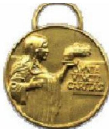
Medaglia di benemerenzza di 3° classe