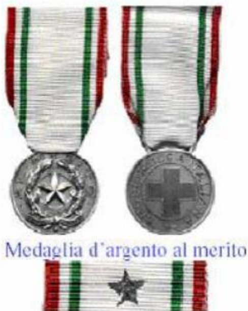
Medaglia d'argento al merito