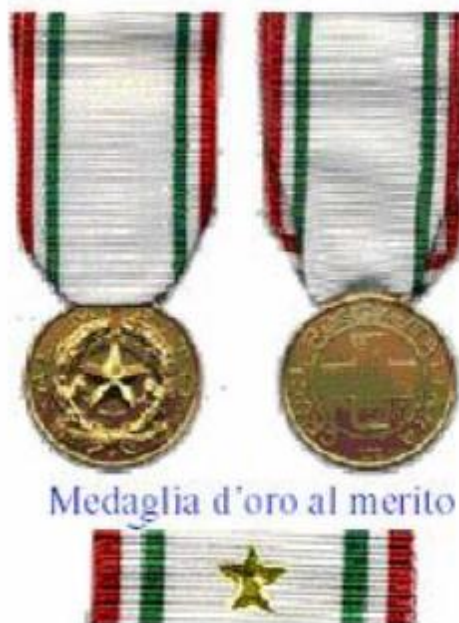
Medaglia d'oro al merito