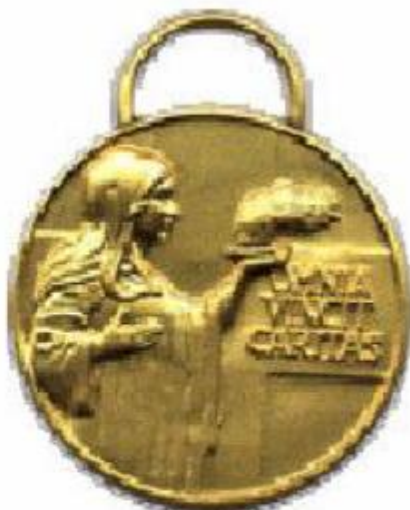
Medaglia di benemerenzza di 2° classe